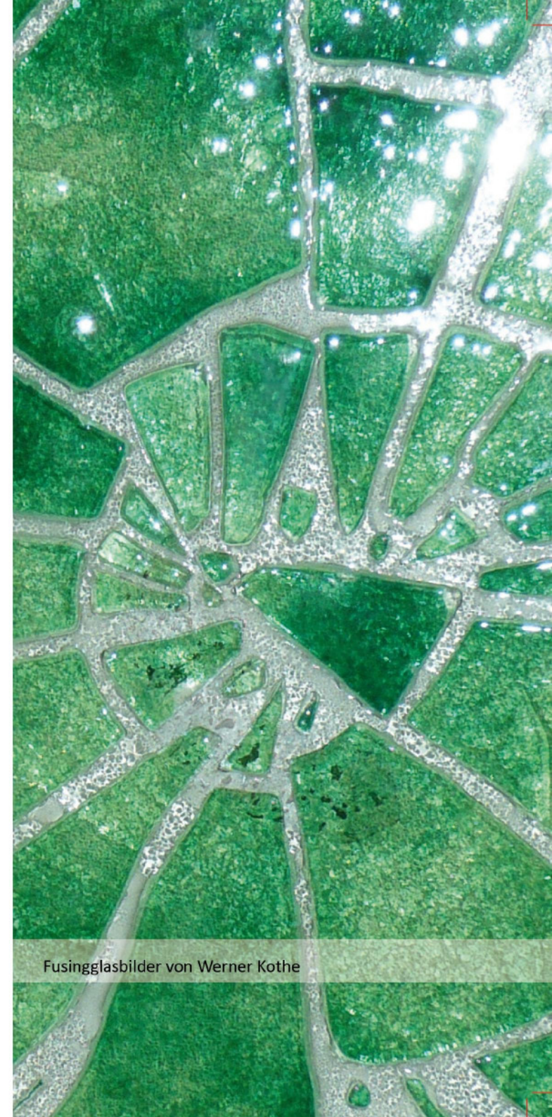
Fusingglasbilder von Werner Kothe

Die Lebendigkeit der Glaskunstobjekte zeigt sich gleichermaßen in der Transparenz bei durchscheinendem Licht und in der Aufsichtsbetrachtung. Die Reflexionen der vollständig oder teilweise geschmolzenen Materialien schaffen mannigfaltige Eindrücke.